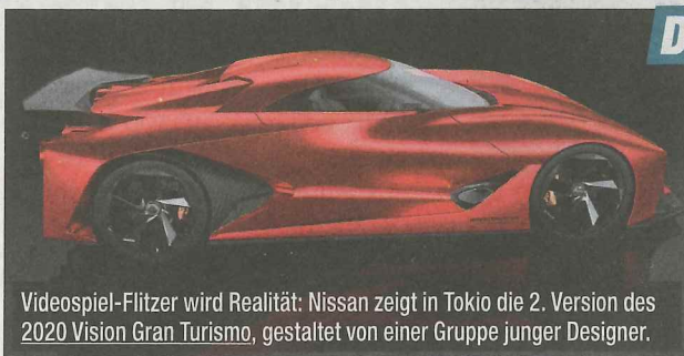
Videospiel-Flitzer wird Realität: Nissan zeigt in Tokio die 2. Version des 2020 Vision Gran Turismo, gestaltet von einer Gruppe junger Designer.

Detroit, Genf, Frankfurt & Co.: Für heuer haben die Autokonzerne ihr Neuheiten-Pulver größtenteils verschossen. Auf der Tokyo Motor Show (bis 8. 11.) geht's deshalb verstärkt auch um einen tiefen Blick in die Zukunft des Automobils – mit teils gewagten Konzepten (s. Fotos). Technisch zeichnet sich ab: Brennstoffzellen werden zunehmend salonfähig ■