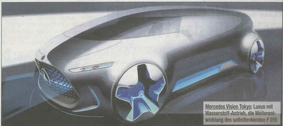
Mercedes Vision Tokyo: Luxus mit Wasserstoff-Antrieb, die Weiterentwicklung des selbstlenkenden F 015

Bereits jeder zehnte hierzulande vom VW-Abgas-Skandal Betroffene hat sich der geplanten VKI-Sammelklage angeschlossen. Ziel bleibt jedoch ein außergerichtlicher Vergleich für alle 363.000 österreichischen Opfer – www.verbraucherrecht.at ■