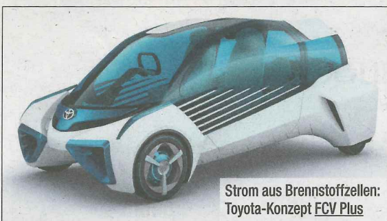
Strom aus Brennstoffzellen: Toyota-Konzept FCV Plus

Detroit, Genf, Frankfurt & Co.: Für heuer haben die Autokonzerne ihr Neuheiten-Pulver größtenteils verschossen. Auf der Tokyo Motor Show (bis 8. 11.) geht's deshalb verstärkt auch um einen tiefen Blick in die Zukunft des Automobils – mit teils gewagten Konzepten (s. Fotos). Technisch zeichnet sich ab: Brennstoffzellen werden zunehmend salonfähig ■